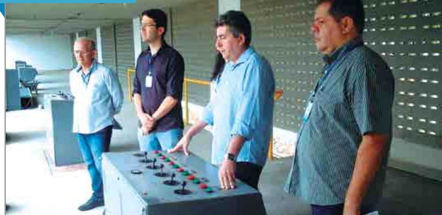
Diretores da Cagepa fizeram uma vistoria nas obras que estão sendo executadas na estação elevatória que abastece o bairro de Tibiri e o conjunto Marcos Moura