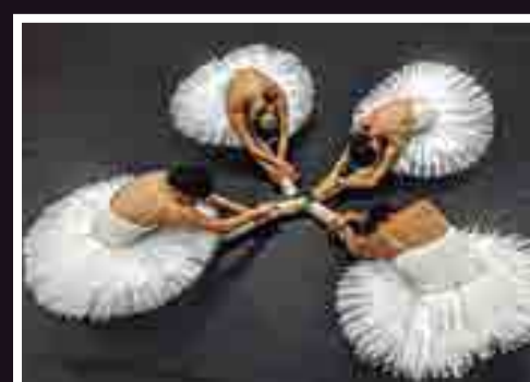
Na imagem maior em destaque, a performance 'Plenitude', do grupo Laboratório de Pesquisa Aérea; nas fotos menores, a partir da esquerda, mais outras atrações do evento, em áreas diversas: 'Aurora das fadas' (circo), 'Verísimos vorazes' (teatro), 'A Erudita' (teatro), 'Pinóquio' e 'A Magia do Lago' (dança)