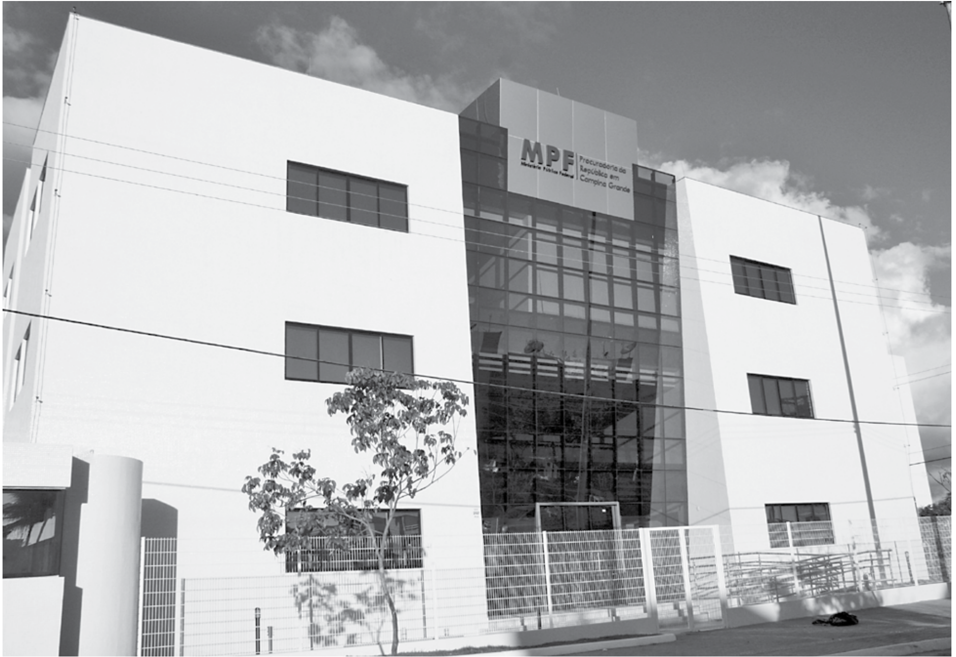
Ao todo, o MPF em Campina Grande denunciou 33 pessoas com envolvimento no esquema de fraudes em centenas de benefícios previdenciários e empréstimos consignados, tendo 30 sido condenadas em primeiro grau

Ao todo, o MPF em Campina Grande denunciou 33 pessoas com envolvimento no esquema, tendo