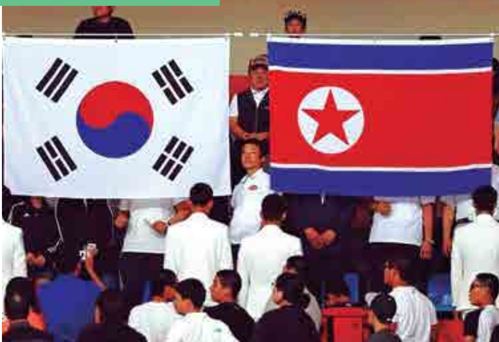
Jogos Olímpicos de Inverno vão acontecer em fevereiro na cidade sul-coreana de PyeongChang