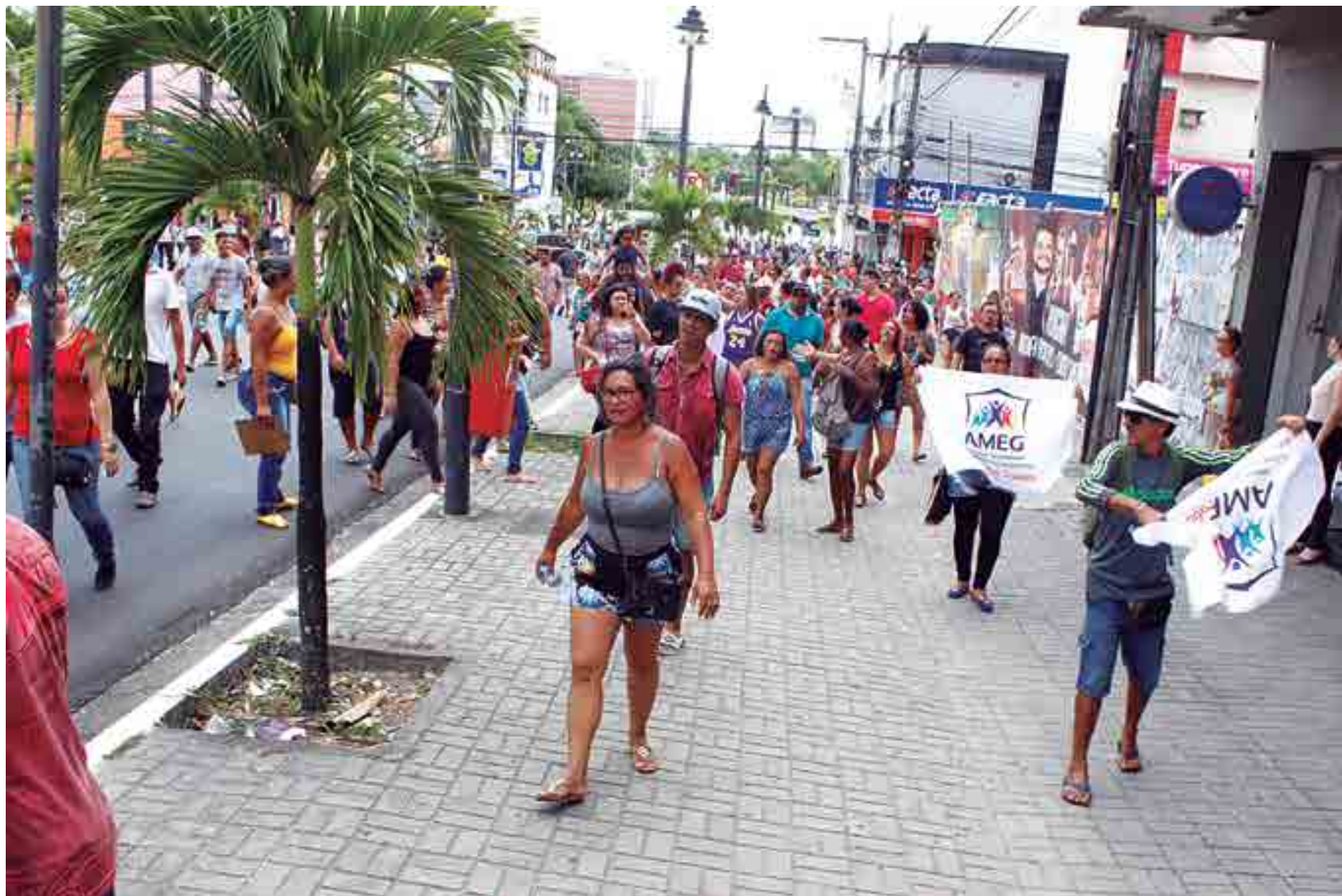
Manifestantes seguiram do Parque Solon de Lucena até o Paço Municipal para tentar audiência com o prefeito ou com o secretário da Sedurb, mas não conseguiram ser atendidos

Ainda sobre o cadastramento, a presidente da Associação disse que com a utilização de crachá vai saber